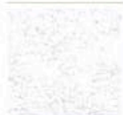
Картон для паспорту COLOURMOUNT артикул № 401 GUELDER ROSE

Стандартный картон для паспорту неприемлим в консервационном оформлении. Стандартный картон можно смело использовать в оформлении заурядных работ, не имеющих коммерческой или иной ценности.