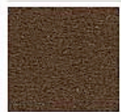
Картон для паспорту COLOURMOUNT артикул № 415 SEAL BROWN