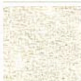
Картон для паспорту COLOURMOUNT артикул № 402 SORREL