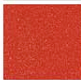
Картон для паспорту COLOURMOUNT артикул № 440 CHINA RED