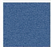
Картон для паспорту COLOURMOUNT артикул № 442 COBALT BLUE