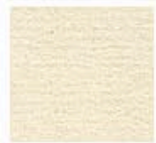
Картон для паспорту COLOURMOUNT артикул № 486 CREAM INGRESE