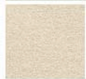
Картон для паспорту COLOURMOUNT артикул № 423 MUSHROOM