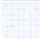
Картон для паспорту COLOURMOUNT артикул № 411 CHALK WHITE