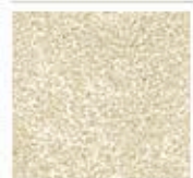
Картон для паспорту COLOURMOUNT артикул № 407 CELANDINE