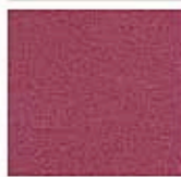
Картон для паспорту COLOURMOUNT артикул № 452 PLUM