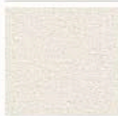
Картон для паспорту COLOURMOUNT артикул № 417 BAMBOO