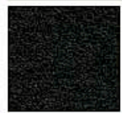
Картон для паспорту COLOURMOUNT артикул № 472 SOLID BLACK