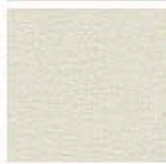
Картон для паспорту COLOURMOUNT артикул № 485 SAND INGRES