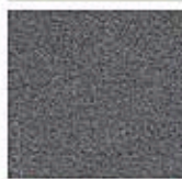
Картон для паспорту COLOURMOUNT артикул № 425 CHARCOAL