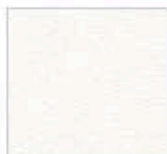
Подложка COLOURMOUNT (музейный) артикул № 3202 BARRIER BOARD

Музейный картон производится на 100% из настоящих волокон хлопка, и не содержит каких-либо техногенных примесей. Хлопковое волокно представляет собой наиболее чистый вид целлюлозы и совершенно не содержит лигнина. Первоначальное значение pH для музейного картона находится между 7.5 и 9.5. Тесты по искусственному состариванию показали, что это значение практически не меняется за 100 и более лет. Структурно, музейный хлопковый картон может быть двух видов: однослойный и двухслойный, правда, в ограниченной гамме цветов. Музейный картон используется как для оформления картин музейного уровня, так и любых других произведений искусства, которые необходимо защитить от старения.