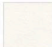
Картон для паспорту COLOURMOUNT артикул № 202 BRIGHT WHITE