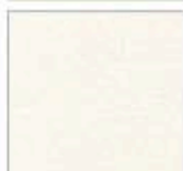
Картон для паспорту COLOURMOUNT артикул № 204 SOFT WHITE